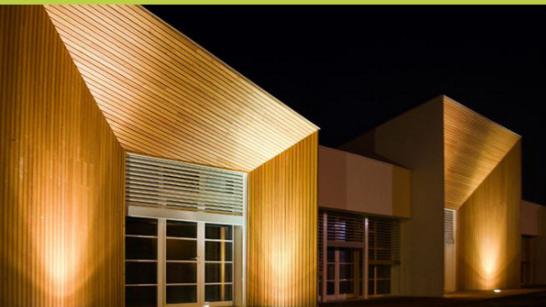
il primo edificio CasaClima School a Cascina (PI)

Casa su misura, Fiera di Padova, via N. Tommaseo 59 - 35131 PADOVA